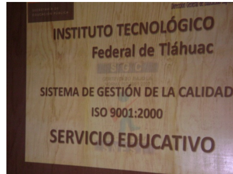
Introducción sobre el SGC

META 3: Implementar un Sistema de Gestión de la Calidad y Ambiental conforma a las Normas internacionales ISO 9001:2000 e ISO 14001:2004.