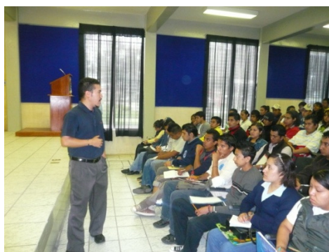
Curso de Inducción a estudiantes

META 2: Generar un proyecto de operación tendiente a prevenir la deserción de los alumnos por reprobación.