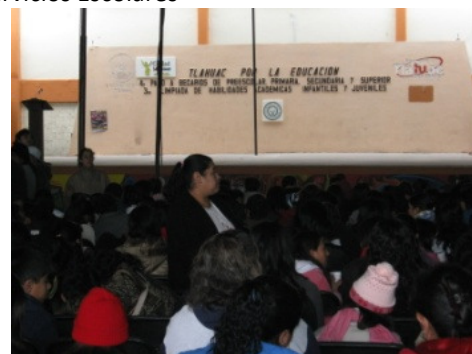
Entrega de apoyos económicos

META 4: Lograr que el 20% de los estudiantes del Instituto sean apoyados con becas de PRONABES o algún otro programa social de apoyo a estudiantes.