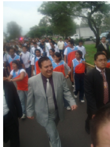
Desfile del Primer Aniversario del Tec

RESULTADO: Se integró al personal en una capacitación constante, así como en actividades académicas, administrativas y sociales, en las que el 100% del personal convocado participó activamente.