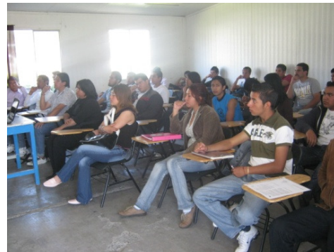
Clase en aula

RESULTADO: Se atendió una matrícula de 662 estudiantes en las tres carreras que oferta el Tecnológico cumpliendo con la necesidad de educación en la comunidad de Tláhuac.