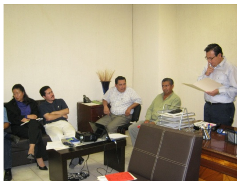
Definición de los cursos a impartir

META 1: Lograr que el 85% de profesores participen en eventos de formación docente y profesional.