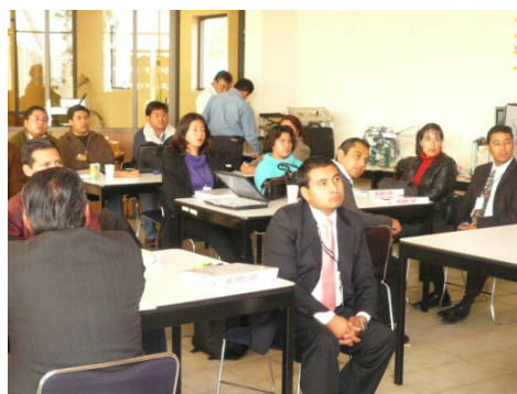
Curso de Competencias Profesionales

RESULTADO: Se impartieron 4 cursos de actualización y formación docente y profesional y se atendió al 100% de los profesores en las diferentes áreas de estudios que se imparten en el Tecnológico.