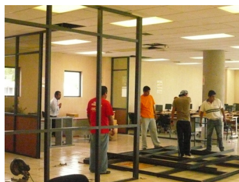
Curso del SGC

META 7: Lograr que el 100% de los directivos y personal de apoyo y de asistencia a la educación, participen en cursos de capacitación y desarrollo.