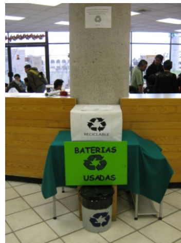
Implementación del SGA

RESULTADO: Se cuenta con la documentación en proceso de implementación del Sistema de Gestión de la Calidad en el plantel para buscar la certificación en la norma ISO 9001:2008, así como con los elementos necesarios para contribuir al desarrollo sustentable y buscar la certificación en la norma ambiental ISO14001:2004.