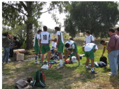
Cuadrangular deportivo estudiantil

META 6: Lograr que el 35% de los estudiantes participen en actividades culturales, cívicas, deportivas y recreativas.