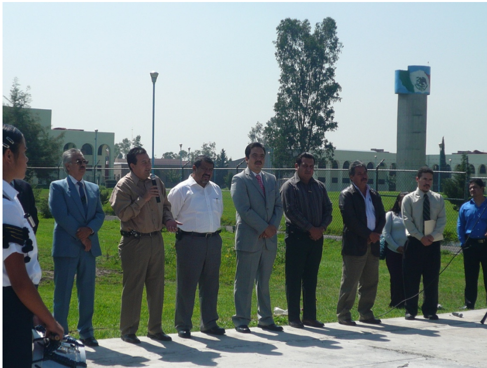
Autoridades delegacionales en evento local