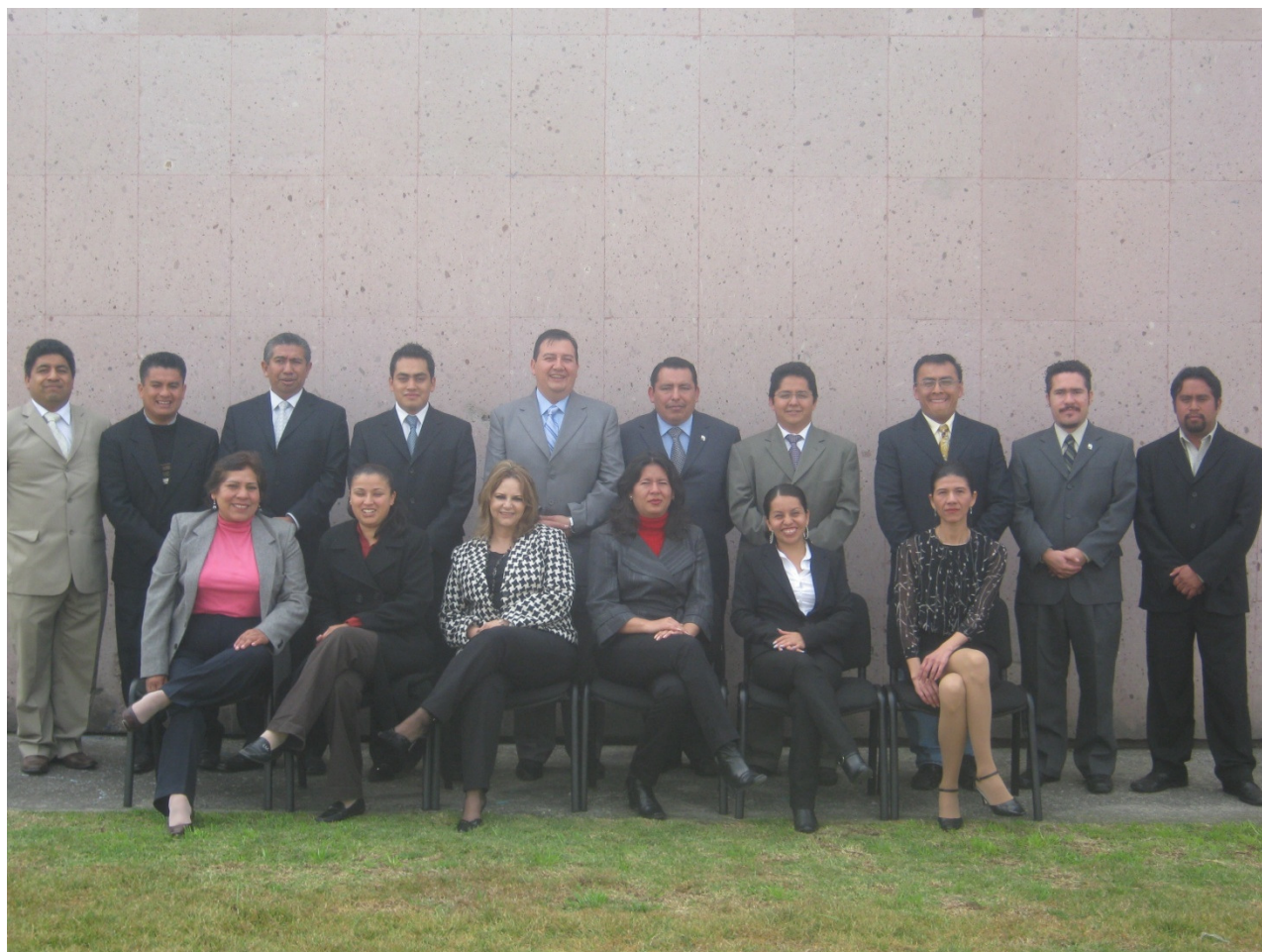
Unidad Directiva del Instituto Tecnológico de Tláhuac