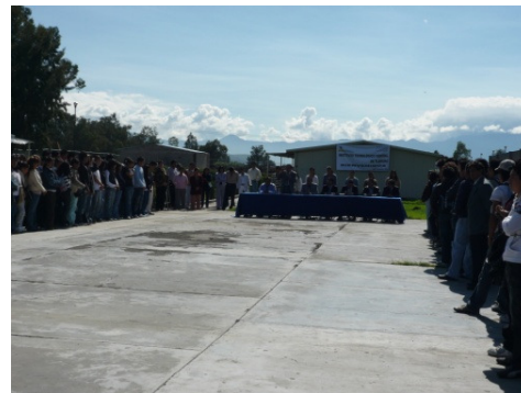
Inauguración de cursos enero – junio 2009

META 5: Lograr una atención para una matrícula de licenciatura de 600 estudiantes.