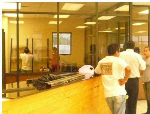
Adaptación de Edificio Administrativo