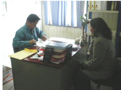
Contratación del personal

META 8: Integración, gestión y trámite oportuno del 100% de las contrataciones, prestaciones procedentes para garantizar la tranquilidad y estabilidad laboral del personal del Instituto y consecuentemente la continuidad en la prestación del servicio educativo.