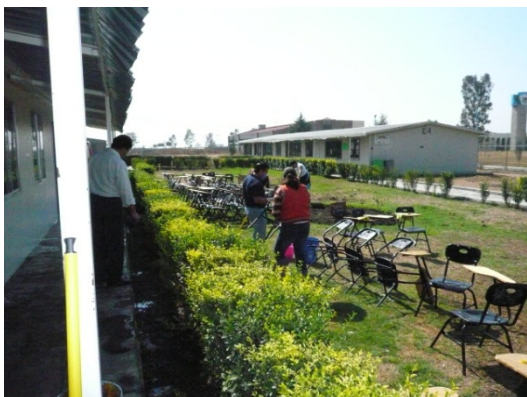
Adaptación de Aulas

Se adquirieron dos vehículos para la operación académica administrativa del Instituto, para cumplir así, con las necesidades de transporte en el Tecnológico de Tláhuac, uno a través de la cuenta de ingresos propios del plantel y otro vehículo por donación de la Dirección General.