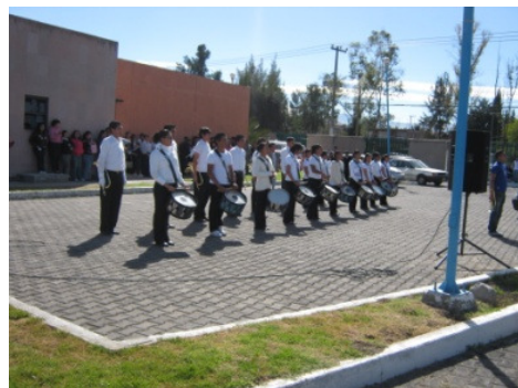
Presentación de la Banda de Guerra

RESULTADO: Se realizaron diversos eventos deportivos (11), culturales (6) y cívicos (7), sumando un total de participación entre todos promedio de 265 estudiantes, considerado como el 25% del total de la matrícula.