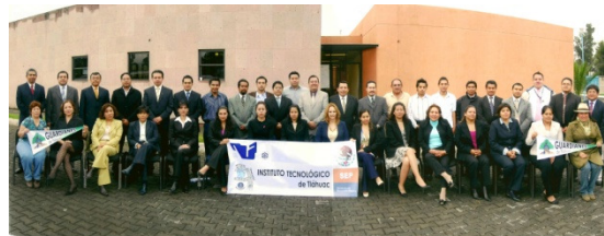
Personal del I. T. de Tláhuac

RESULTADO: Se cuenta con una plantilla de 36 docentes, 5 administrativos, y 3 directivos de los cuales el 100% de sus trámites correspondientes fueron integrados y gestionados en trámites para contratación, recontractación y prestaciones del Sistema.