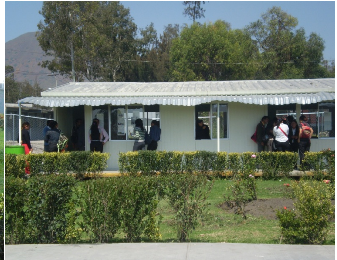
Instalaciones provisionales del I. T. Tláhuac