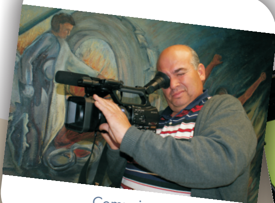
Comunicación y Difusión