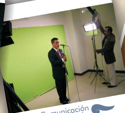
Comunicación y Difusión