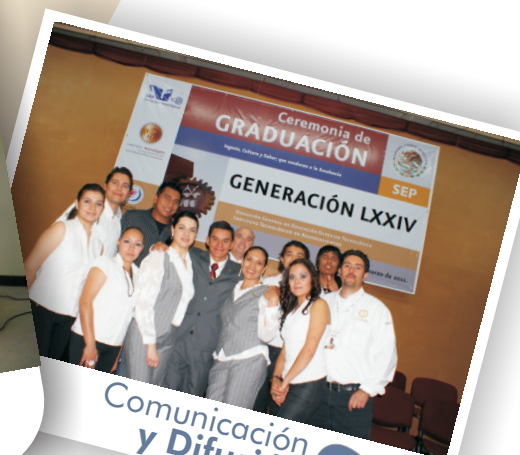
Comunicación y Difusión